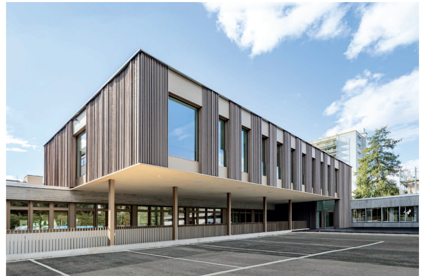
Umbau und Aufstockung: zentrale neue Räume für die Musikschule Birsfelden im Bestand der Primarschule Sternenfeld